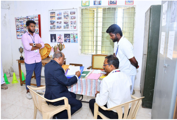
Department of Physical Education