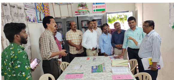
Principal and staff after in the CKC centre along with Mock Peer Team from CCE office