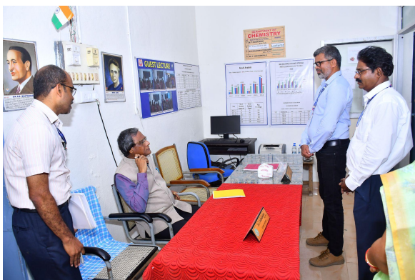
Department of Chemistry