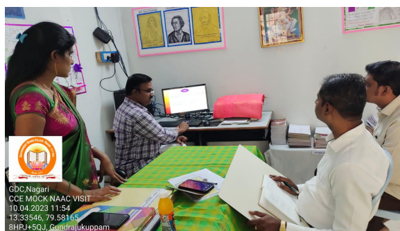
Department of Mathematics