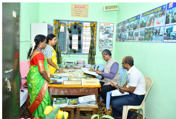
Department of Botany