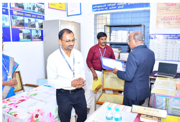
Department of Tamil