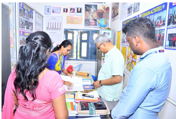
Department of History