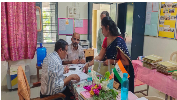
Department of English