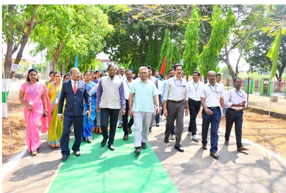
Formal invitation of NAAC Team Members by Principal and Staff