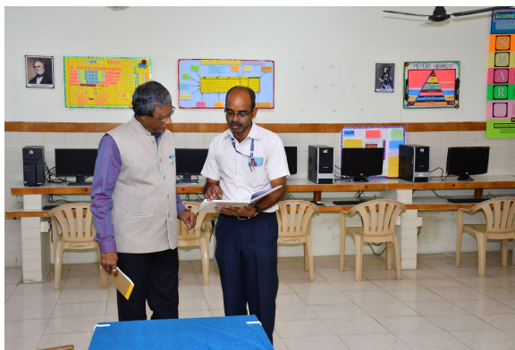
Department of Computer Applications