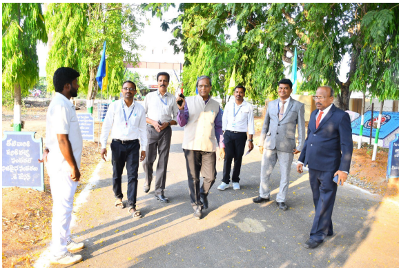
Physical facilities observation