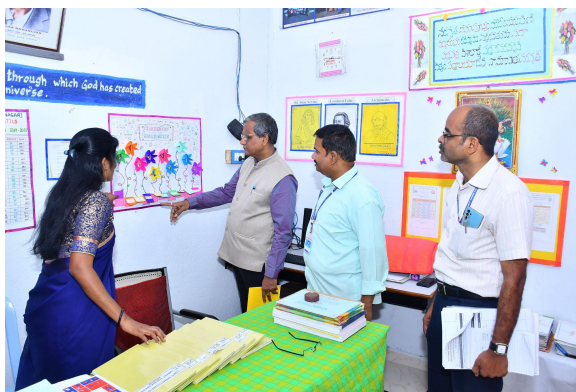
Department of Mathematics