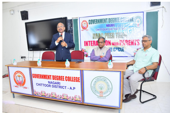
Interaction with parents