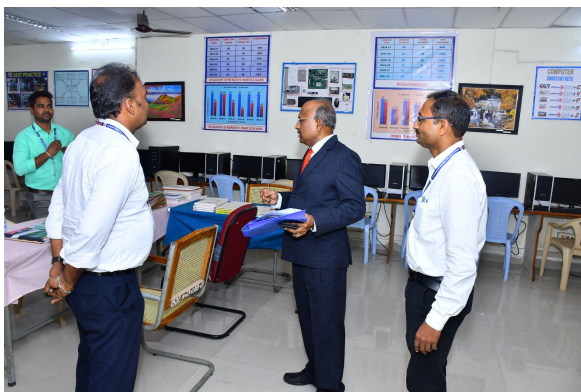
Department of Computer Science