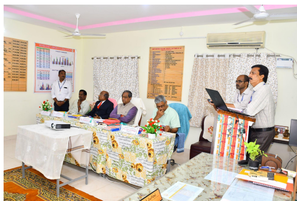
PowerPoint Presentation by the Principal