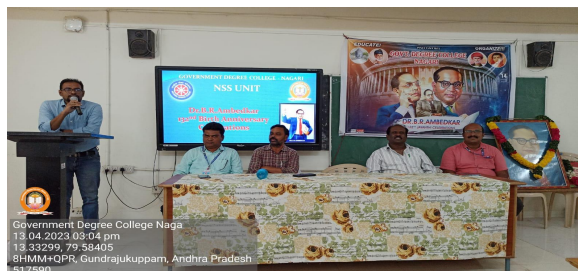
Staff addressing the gathering on the eve of celebrations