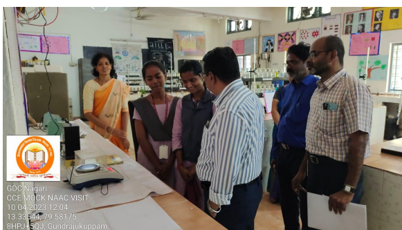
Department of Chemistry