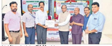
ప్రెసిడెంట్ లామండుస్యూ, నాగ్ పీఠీకీ అధ్యక్షులు

ఈ అంశాల ప్రధానం వివరించు సీర్లం చేసి నాగ్ తీర్మానంలో అదోకే నేనుకట్ట చెప్పారు. నాణ్యమైన విద్యను అందించడంతో పాటు విద్యార్థుల సౌకర్యాలను, అభ్యుదయం తీర్లం కళాశాలను నాగ్ ముందీ గ్రేడ్ కేటామిస్టరును తెలిపారు. పనికోసం సందర్శించి నాణ్యత ముఖ్యమైనవారు. విద్యార్థులలో నైపుణ్యాలను మెరుగుపరచాలని, నైపుణ్యతలను పెంచుకుంటున్నారని సూచించారు.