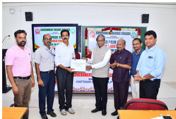
PTV Report to Principal