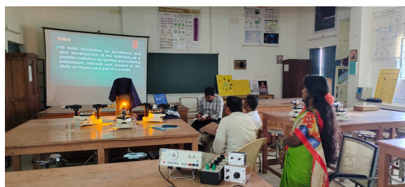
Department of Physics