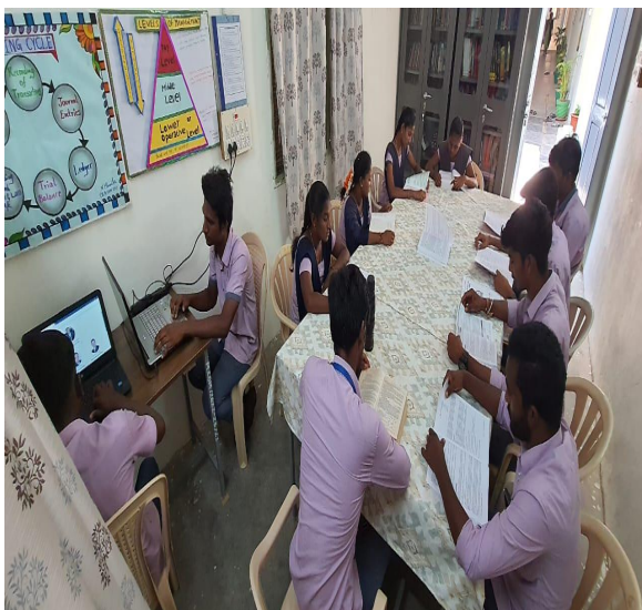
Students at the CKC centre