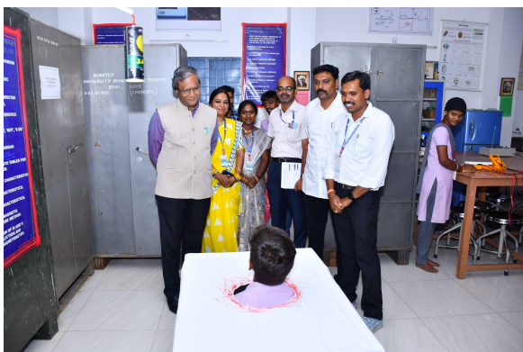
Department of Physics