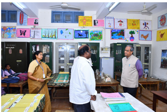
Department of Zoology