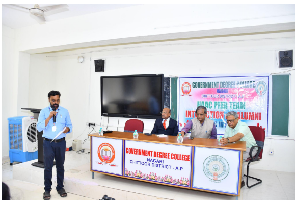
Interaction with alumni