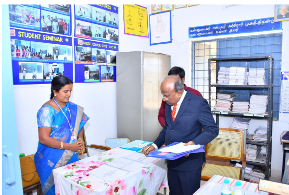
Department of Statistics