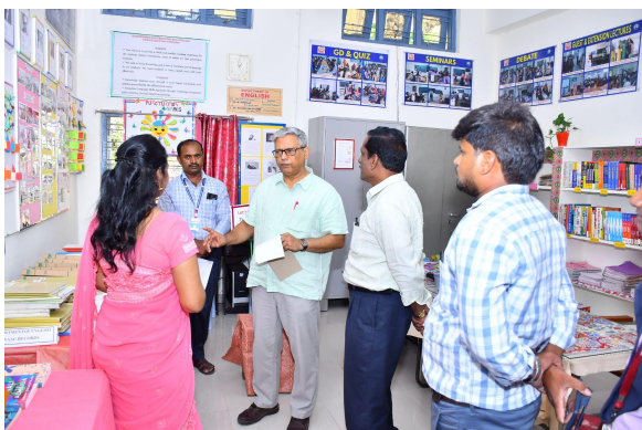
Department of English