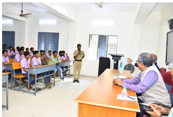
Interaction with students