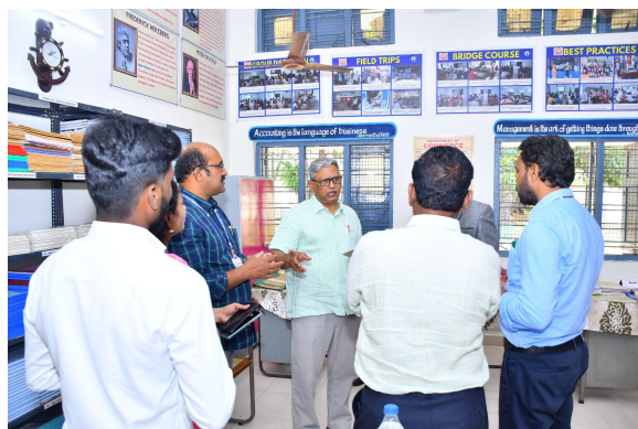
Department of Commerce