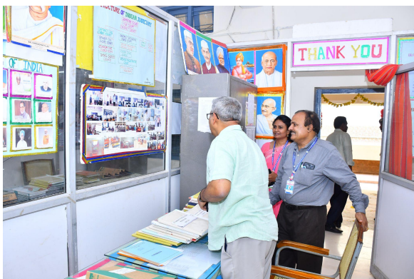
Department of Political Science