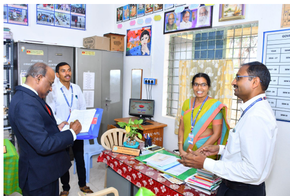
Department of Telugu