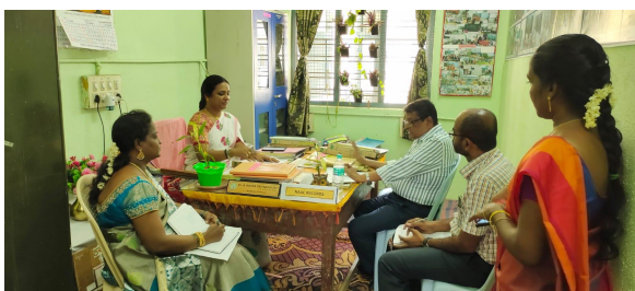
Department of Botany